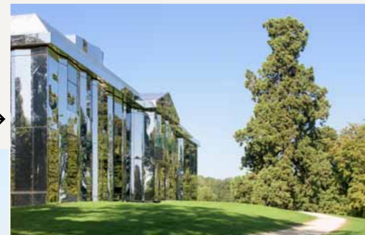
Parc culturel de Rentilly - Château - ©Walter / ADAGP, 2014. © Martin Argyrogis