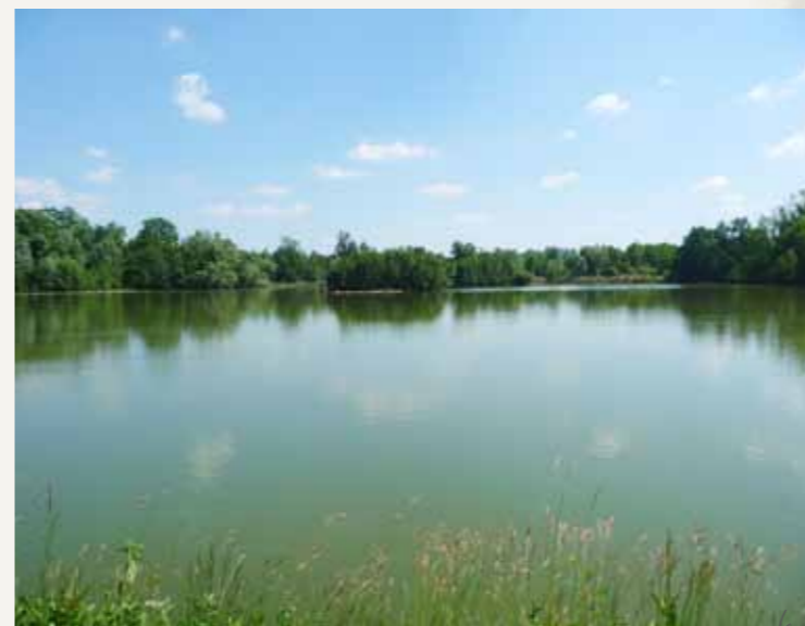
↑ village de la Brosse

Aujourd'hui propriété privée, le château accueille des séminaires. Vous pouvez apprécier la vue de l'imposante demeure et de ses jardins depuis l'avenue des deux Châteaux et, en contre-bas, le panorama sur la vallée de la Gondoire et le village de Gouvernes.