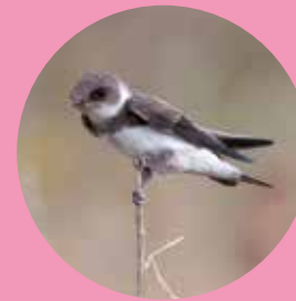
Hirondelle de rivage