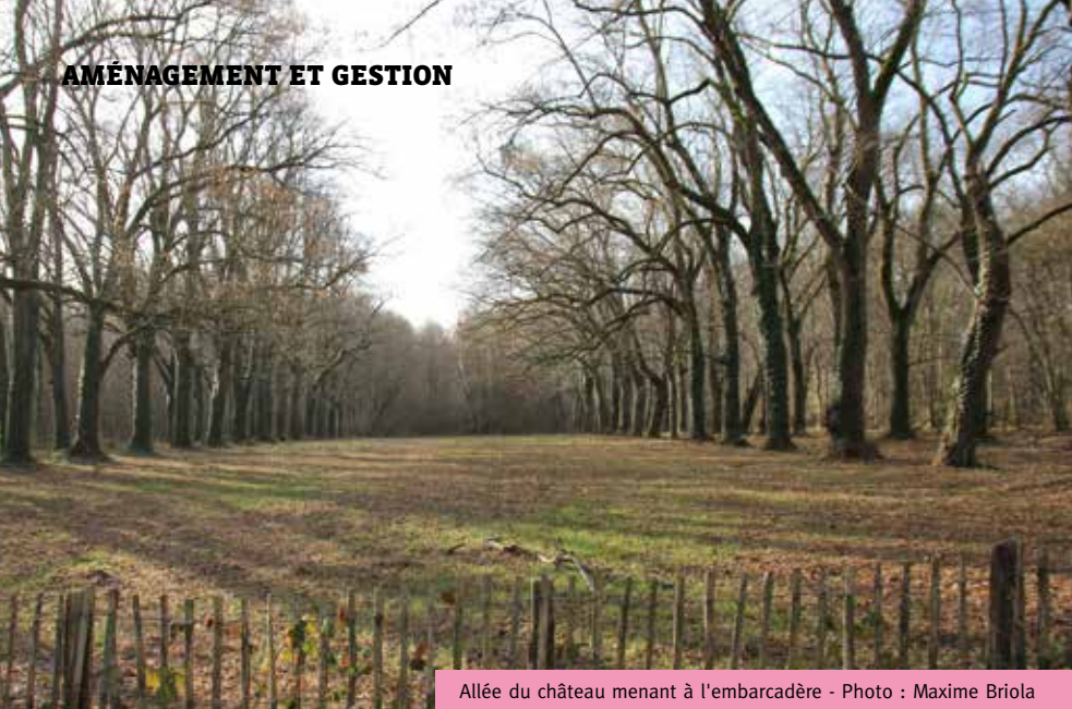
Allée du château menant à l'embarcadère