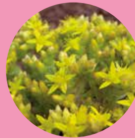
Orpin âcre

La création des plans d'eau a permis de favoriser la présence d'oiseaux aquatiques (grèbe huppé, héron cendré, martin-pêcheur, etc.) ou évoluant au-dessus de l'eau comme l'hirondelle de rivage. D'autres espèces rares ont été vues sur le grand étang comme le harle bièvre, le garrot à œil d'or ou encore le canard chipeau.