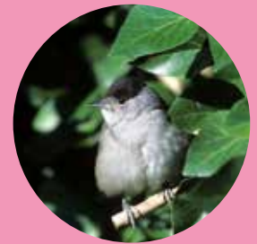
Fauvette à tête noire