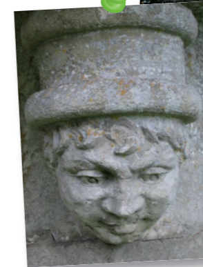
Sculpture du péristyle du château