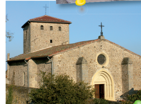
L'église et son clocher trapu