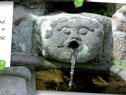
Fontaine « Bondon » à Laurisse