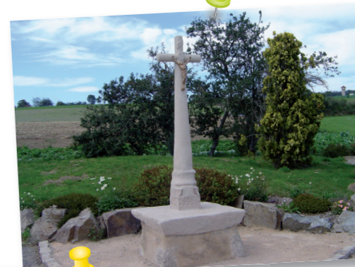
Croix des Hommes Morts