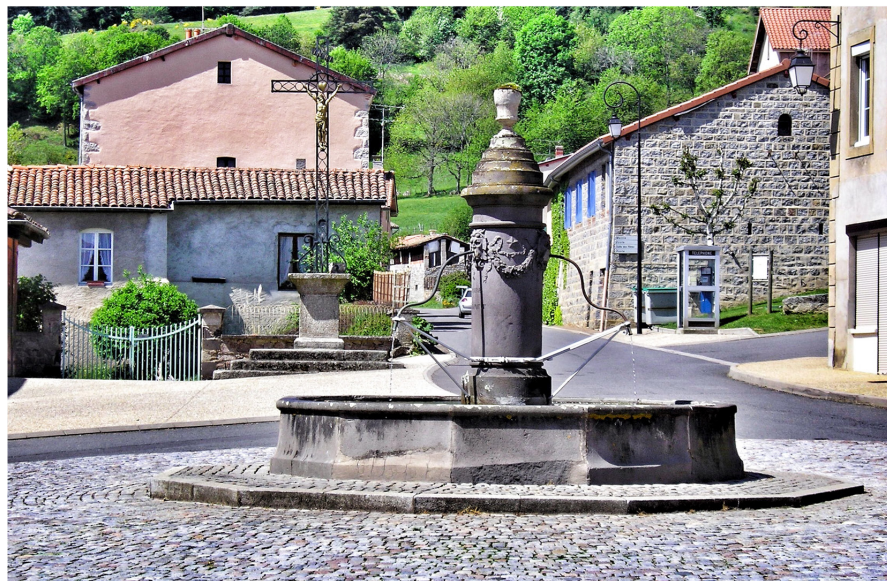
Fontaine à Saint-Didier-sur-Rochefort