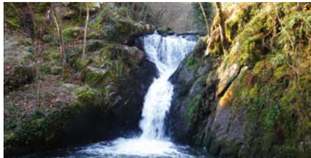
Cascade de Vachand

D (GPS : 0461131-4955838 ) Parking devant la Mairie. Suivre la route principale sur la gauche sur environ 650 m, puis prendre à droite une petite route. Arrivé face à un hangar, s'engager sur le chemin en face en gardant le bâtiment à main droite. Après quelques mètres, tourner à gauche et poursuivre jusqu'à rejoindre la petite route du Moulin de Vachand. Descendre à droite jusqu'au moulin.