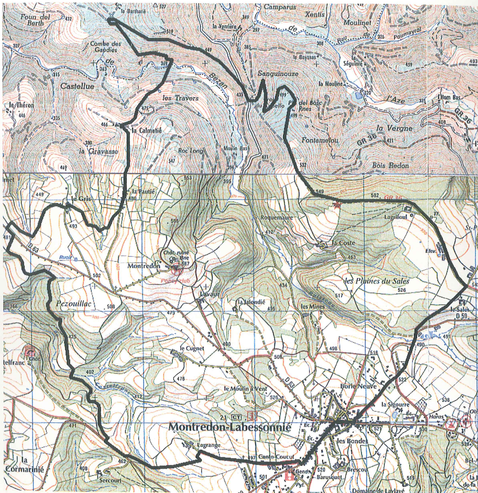
N°8 – SENTIER DE LA BARONNIE