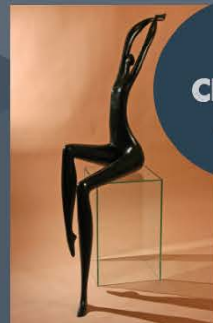
6 CÉLESTE Bronze 1993

Avec cette créature cabrée, bienveillante, aux trois têtes mi-cheval, mi-serpent, bien éloignée de l'hydre de la mythologie grecque dont elle s'est sans doute inspirée, nous voyons surgir de l'imaginaire de Livio une représentation saisissante des jaillissements de la vague en perpétuel mouvement.