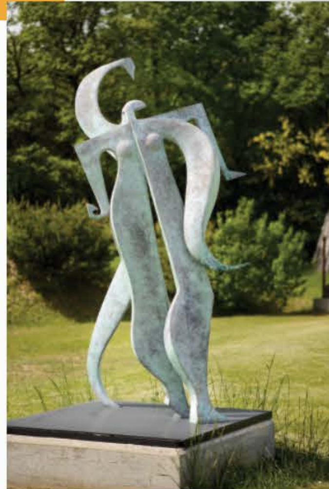
5 TANGO Bronze 2006

Les deux composants de ce couple stylisé se répondent dans un mouvement qui nous appelle à les observer en en faisant le tour.