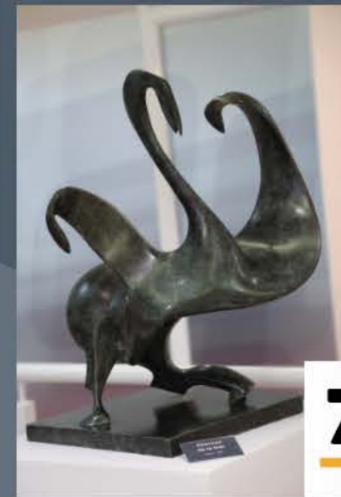
7 CHEVAUX DE LA MER Bronze 1983

Ainsi l'artiste nous convie à donner avec lui le statut d'Art vivant à cette danse populaire universelle.