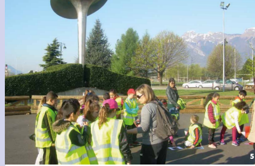
7. Jeu de piste 8-12 ans