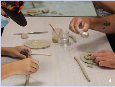
4. Atelier poterie