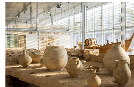
Patrick Ageneau / DR Musée gallo-romain SRG

Période d'ouverture : Fermé temporairement.