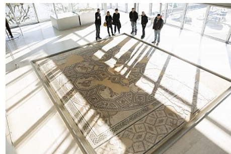
DR Musée gallo-romain SRG

Toute l'année, venez découvrir les collections permanentes grâce aux parcours découvertes et aux ateliers enfants. Le musée abrite tous les ans des expositions temporaires et propose des animations musicales, contées ou exceptionnelles comme les Journées gallo-romaines ou encore les Vinalia (vendanges romaines).