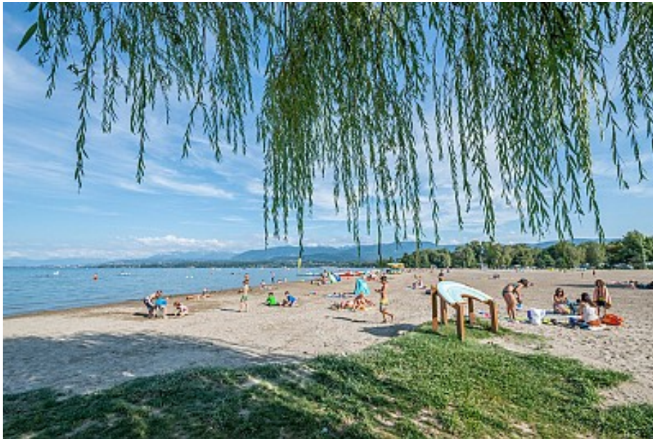
Destination Léman / Antoine Berger