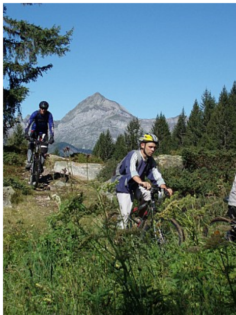
OTI Val d'Arly

Venez vous initier aux bases du VTT en parcourant les espaces ludiques du Val d' Arly ! La zone ludique de Crest- Voland est divisée en 3 sous parcours avec chacun un thème relié à un animal de la forêt : la Belette, l'Écureuil, et la Grenouille.