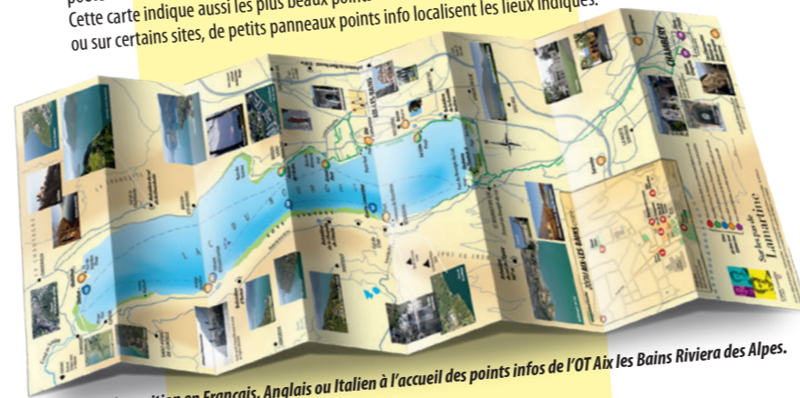
Carte à disposition en Français, Anglais ou Italien à l'accueil des points infos de l'OT Aix les Bains Riviera des Alpes.

L'office de tourisme Aix les Bains Riviera des Alpes propose une carte touristique du lac du Bourget et de ses environs vous permettant de retrouver les lieux fréquentés par le poète. Pour chaque site un texte précise quelles sont les circonstances de sa venue. Cette carte indique aussi les plus beaux points de vue sur le lac. Sur place à Aix-les-Bains ou sur certains sites, de petits panneaux points info localisent les lieux indiqués.