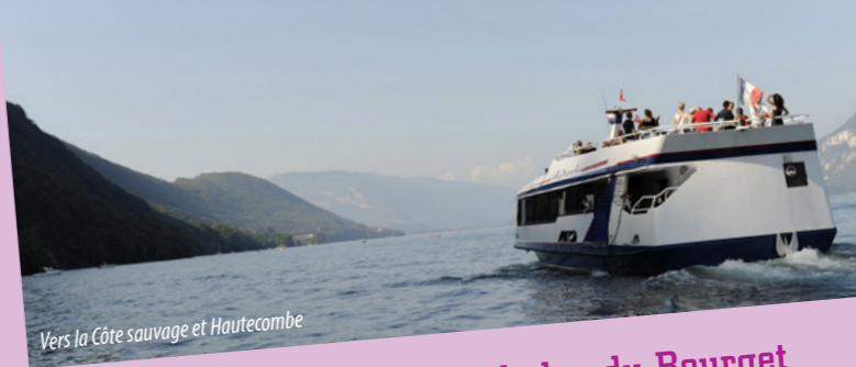
Vers la Côte sauvage et Hautecombe

Lieu de départ : Le Grand port devant le point infos de l'OT, RDV 30 minutes avant.