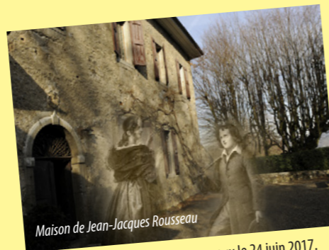
Maison de Jean-Jacques Rousseau