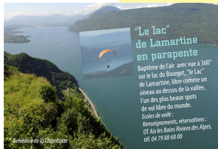
Belvédère de la Chambotte