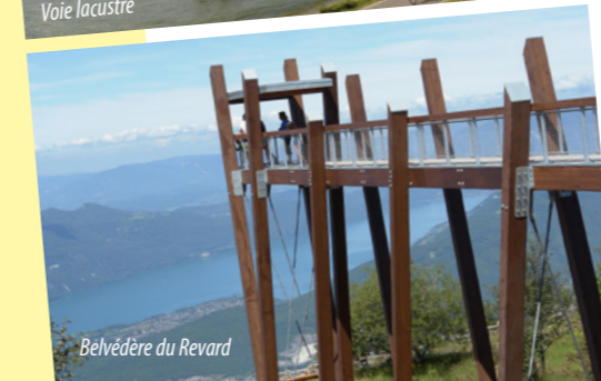
Belvédère du Revard