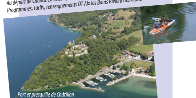
Port et presqu'île de Châtillon

Programmes, tarifs, renseignements OT Aix les Bains Riviera des Alpes.