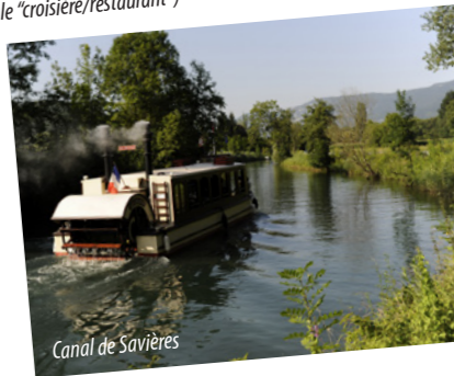
Canal de Savières

Renseignements OT Aix les Bains Riviera des Alpes tél. 04 78 88 68 00