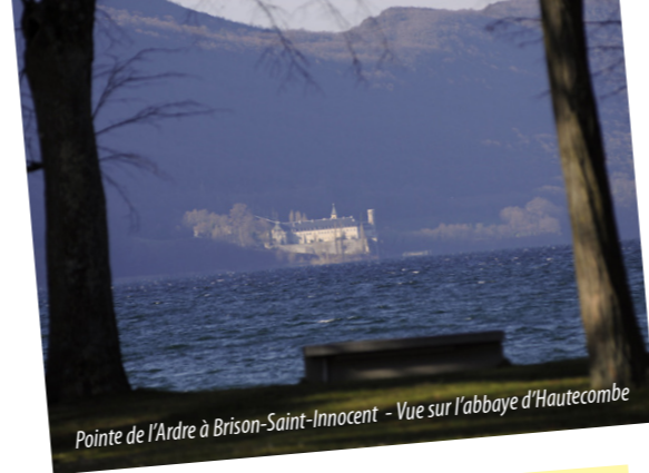
Pointe de l'Ardre à Brison-Saint-Innocent - Vue sur l'abbaye d'Hautecombe