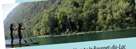
Location de canoé ou paddle au départ : le Bourget-du-Lac En sorties accompagnées : Renseignements OT Aix les Bains Riviera des Alpes, tél. 04 79 88 68 00

Partez vers Bourdeau, la grotte et l'abbaye d'Hautecombe à la découverte de la cote sauvage, lieu de l'inspiration du poème "Le Lac" là même où le poète et Julie venaient suspendre le temps...