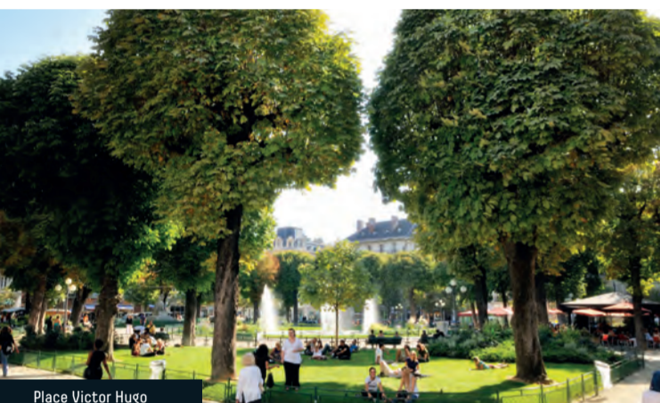
Place Victor Hugo