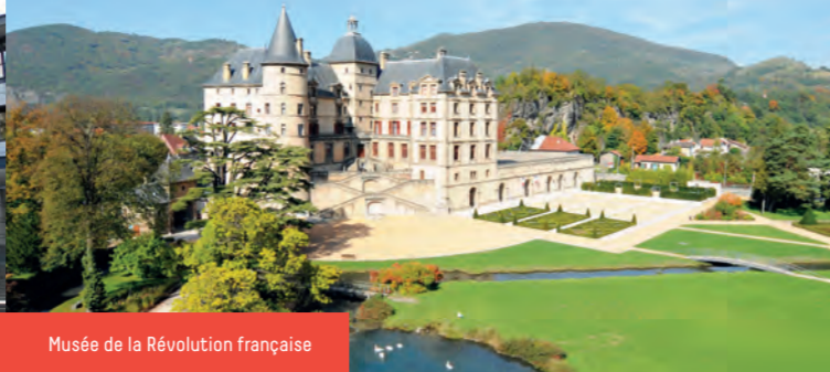
Musée de la Révolution française

Musée archéologique et crypte Saint-Oyand du I er siècle. Horaires : ouvert tous les jours sauf le mardi, 10h-18h. Fermé les 1 er janvier, 1 er mai et 25 décembre.