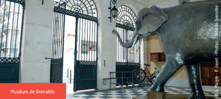
Muséum de Grenoble

Monument historique orientaliste en ciment moulé [or gris] du XIX e siècle. Horaires : ouvert le premier samedi de chaque mois à 14 h. Plein tarif: 8 €.