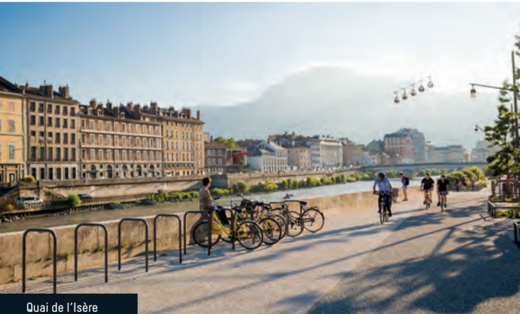
Quai de l'Isère