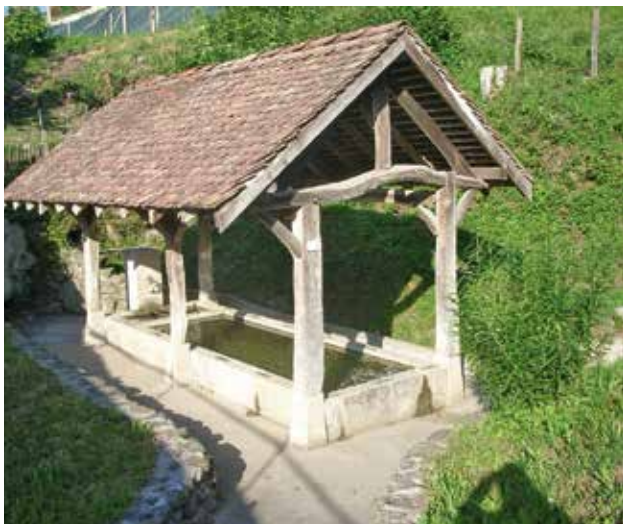
Lavoir de Villeneuve d'Uriage

Après une courte montée, on atteint le point culminant du parcours (615 m) et on poursuit en pente douce sur la crête avec vue sur Belledonne à gauche, le Vercors à droite et la Matheysine en face. Ignorer à droite un chemin qui monte dans les champs puis, peu après, un chemin qui rejoint une ferme, pour continuer à descendre sur la crête. A une fourche, laisser à gauche un chemin qui dessert une maison. On passe devant une table d'orientation avant d'atteindre une bifurcation à la lisière de la forêt.