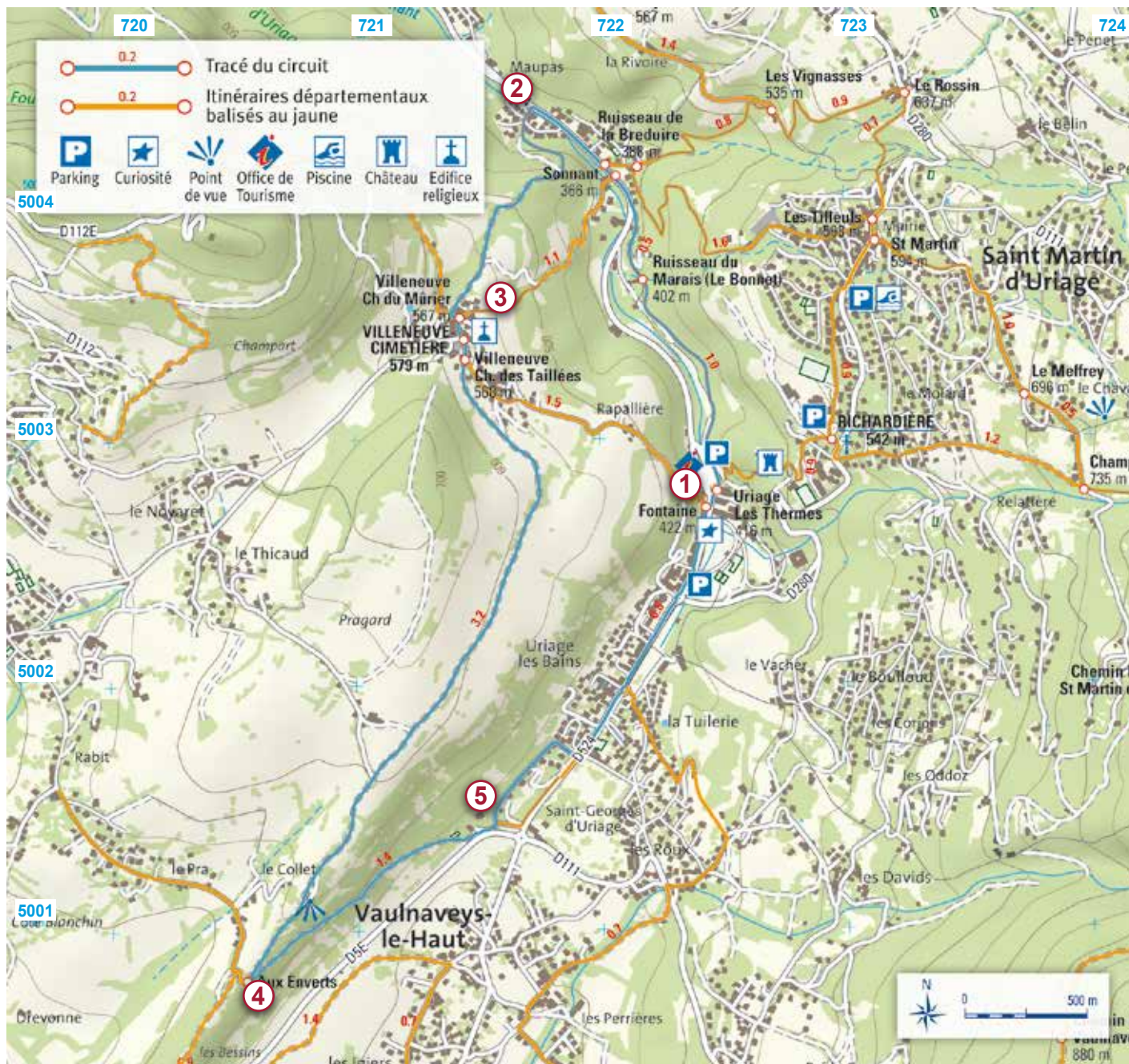
Les croisillons bleus correspondent au carroyage kilométrique UTM-WGS84 - Carte Mogoma