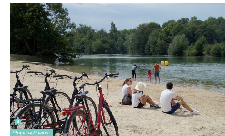
Plage de Meaux