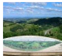
Légende : Circuit U-U1 : La Châtillonnière

Balisage : lettre du circuit sur fond bleu. Départ place du Plon. Ce parcours vous emmènera à Rochefort, sur les anciens chemins pavés qui menaient à la forteresse. Ce sentier serpente dans les bois, sur un versant assez sauvage, avec un beau panorama.