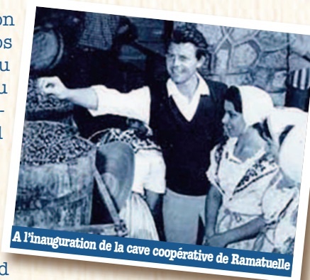
A l'inauguration de la cave coopérative de Ramatuelle

Acteur de renommée mondiale, Gérard Philipe a su rester à jamais un enfant de Ramatuelle.