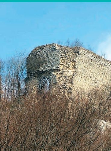
Ruines du Château de Montbel. C.Maurel