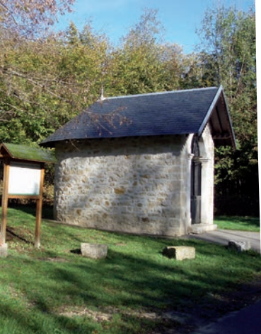
Chapelle du col du Banchet. C.Maurel