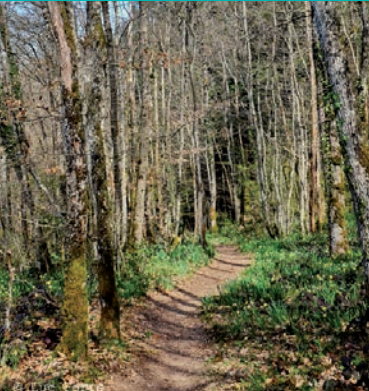
GR9 en forêt d'Ayn. L.Farré