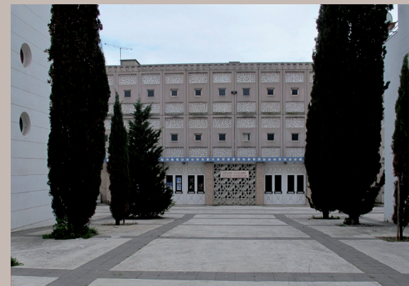
Cité HLM et école Scheppler années 1960