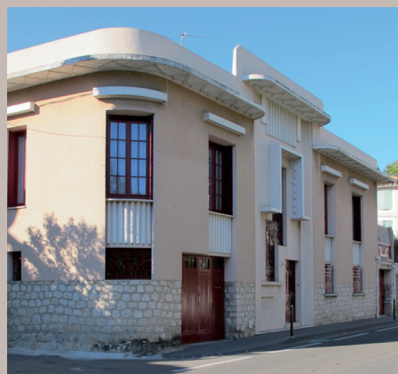
Maison Art Déco, années 1920 8 Bis avenue Monclar