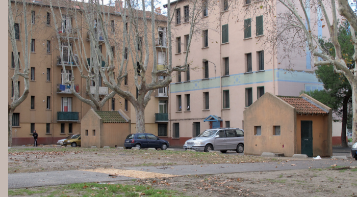
Cité Louis Gros 1932