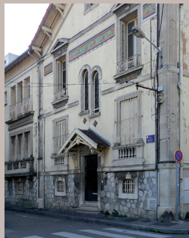
Maison représentative de l'habitat du quartier au début du XXe s. décor céramique, rue Bastet