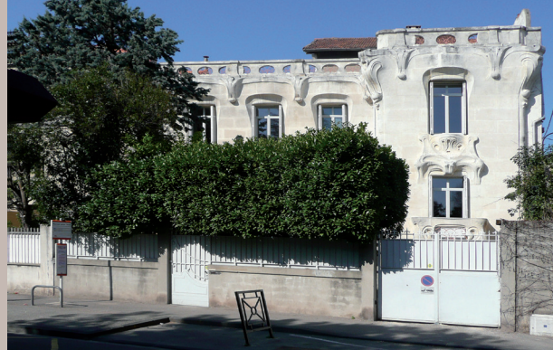
Maison Art Nouveau, 10 avenue Monclar années 1900, Boch architecte