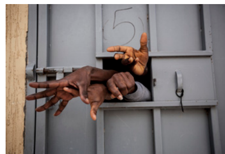
Narciso Contreras - Garabuli, mars 2016 © Narciso Contreras pour la Fondation Carmignac