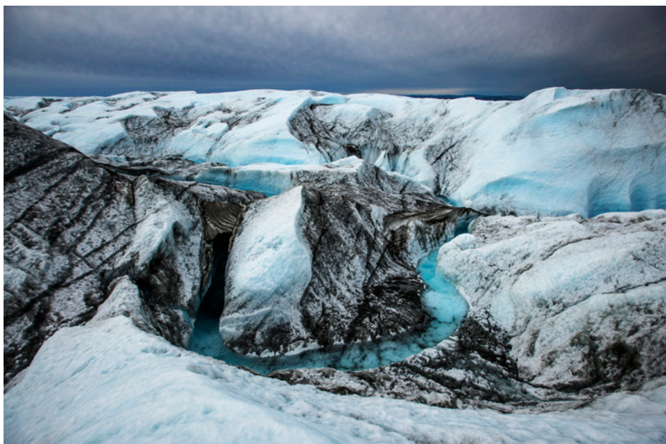
Kadir van Lohuizen - Kangerlussuaq, Groenland, juillet 2018 © Kadir van Lohuizen / NOOR pour la Fondation Carmignac