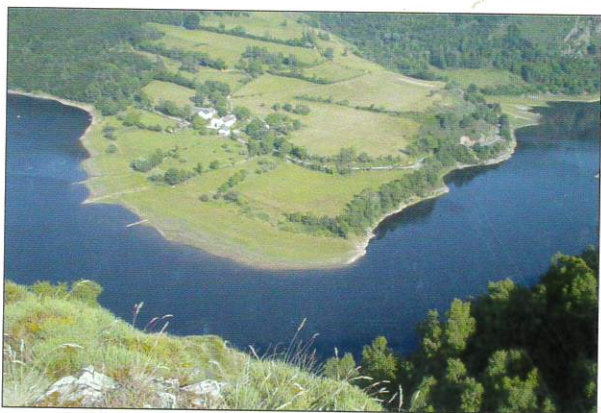
Le point de vue du Pouget dit "le rond du Pouget"

Si le village de MALLET a vécu une longue existence, et disparu par une ironie du sort, les ruines du château veillent encore sur le village englouti !