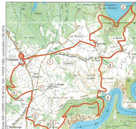
Carte IGN 1:25000 n° 25-36 Est. IGN - PARIS 1983, autorisation n° 90-1510

D Depuis la place du village, prendre direction Garabit, traverser la RD13 et prendre la route en face.