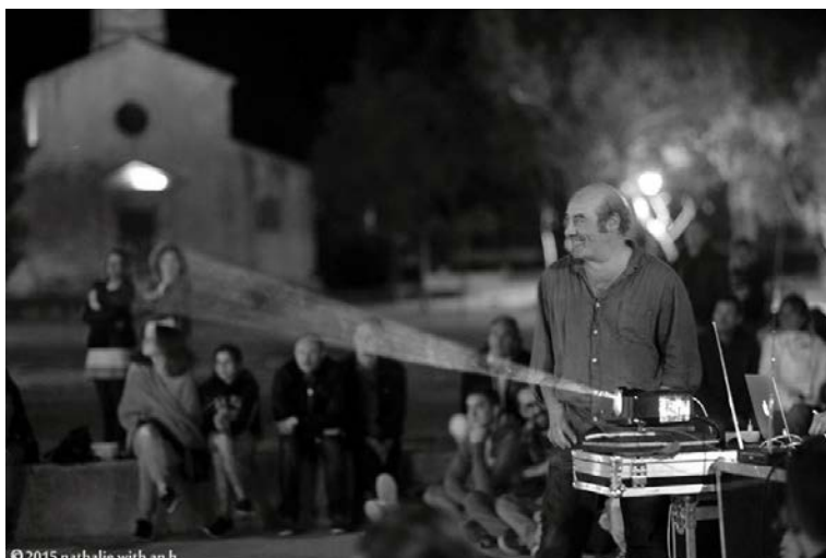
© 2015 nathalie with an h