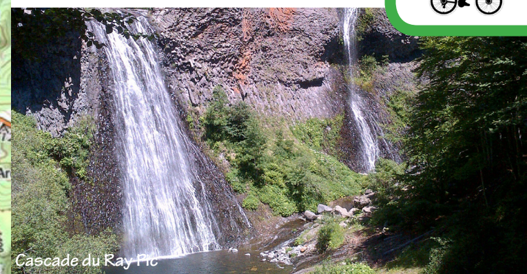
Cascade du Ray Pic

4 - Sur la ligne de partage des eaux - Facile