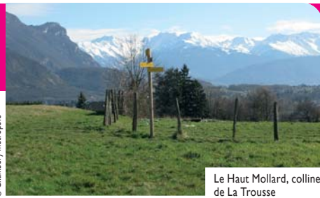
Le Haut Mollard, colline de La Trousse

Un itinéraire champêtre pour découvrir la colline de la Trousse, à l'extrémité Nord de la commune de La Ravoire. Ce plateau agricole aux contreforts boisés, est un îlot verdoyant, un poumon vert, offrant une vue panoramique au milieu de la cluse urbaine de Chambéry.