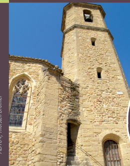
Graphisme : www.traceapi.com, ©ADTHV, Nicolas Roussin, ADTB4, Thérèse Brumer