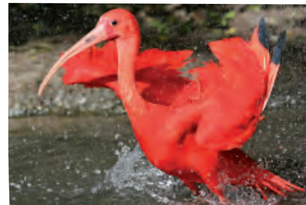
Le Parc des oiseaux à Villars les Dombes : Partez pour un tour du monde à vol d'oiseaux au milieu de 400 espèces venant des 5 continents.