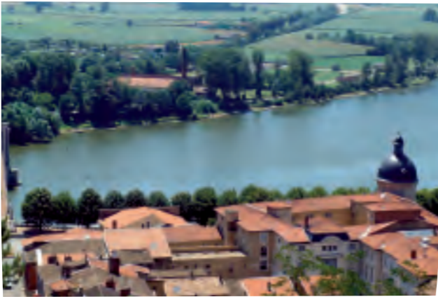
Les villages du Val de Saône sont presque tous bâtis au flanc des pentes des vallons creusés par les rivières