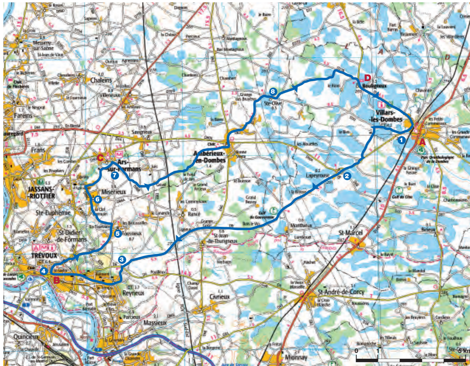
Cartes IGN 1 : 100 000 n° 44 et 51