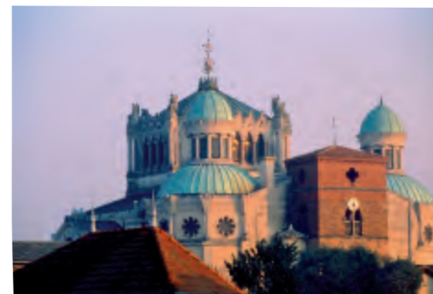
Ars-sur-Formans. Le village du saint curé, haut lieu de pèlerinage...