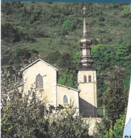
Église de Lucey