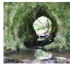
Légende : Circuit N°2 : La Forêt

Balisage jaune numéroté. Sens conseillé : Larajasse - La Marthaudière. Circuit assez accidenté sur 1km après la fin du village. Vue dégagée en direction du village de Coise et de sa chapelle de la "Peur". A mi-circuit, traversée d'un bois très agréable.