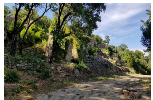
Ancien village des Martins