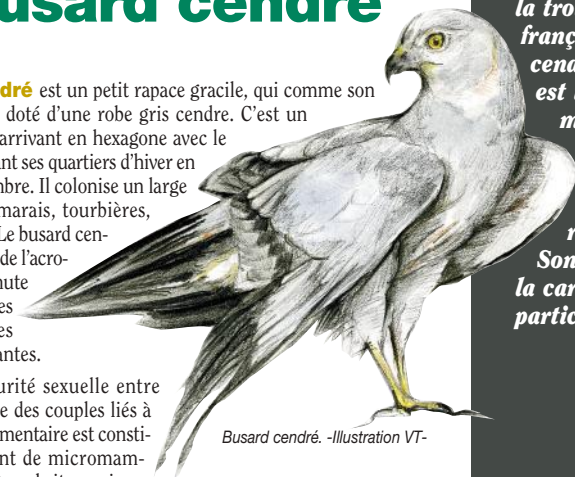
Busard cendré. -Illustration VT-

Le Montfouat avec ses prairies de pâturages et ses larges espaces est un milieu privilégié pour le busard cendré, peut-être l'apercevrez-vous au détour du chemin.