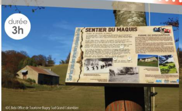
Office de Tourisme Bugey Sud Grand Colombier