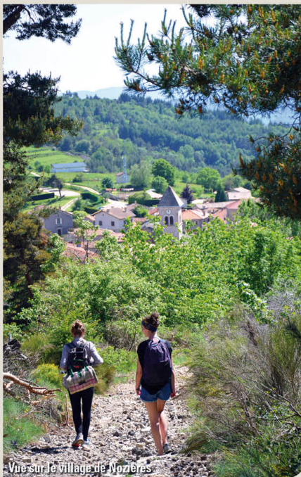
Vue sur le village de Nozières