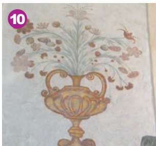
Détail d'une fresque

À côté de l'église, vous observez une partie du château. Faites demi-tour et descendez dans le centre du bourg (par la montée de l'église). Dirigez-vous à gauche, traversez à nouveau la route départementale pour retrouver le parking de la mairie (en face).