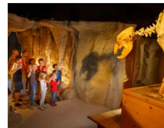
Musée de l'Ours des Cavernes