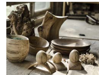
Peter Pan Bois