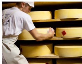
Coopérative laitière des Entremonts

Informations et autres idées de visites sur www.chartreuse-tourisme.com/rsf ou sur la carte de la Route des Savoir-Faire et des Sites Culturels (disponible gratuitement dans les offices de tourisme du massif).