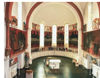
Musée Arcabas en Chartreuse

ou sur la carte de la Route des Savoix-Faire et des Sites Culturels (disponible gratuitement dans les offices de tourisme du massif).