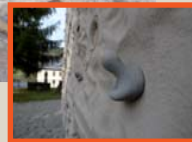
Mur artificiel, place du chateau Hauteur : 6 m