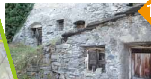
Le Goutaud, hameau typique.