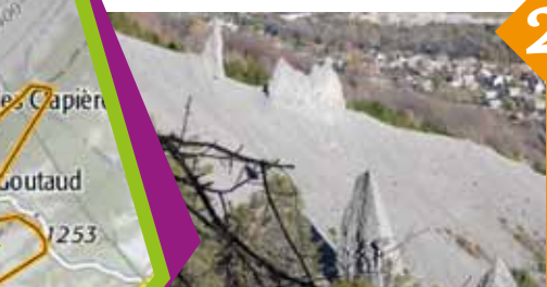
Les Demoiselles décoiffées, érosion de la moraine glaciaire.