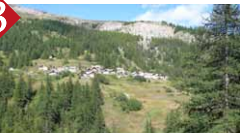
Vue sur Les Combes, hameau d'estive à 1800 m d'altitude