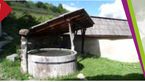
Fontaine de Puy Chalvin, au coeur du hameau.