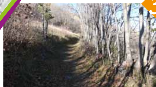
Un chemin, magnifique balcon.