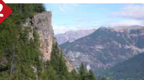
Rocher de Roure, panorama vertigineux à 1840m d'altitude.