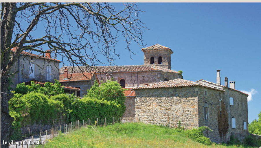
Le village du Crestet