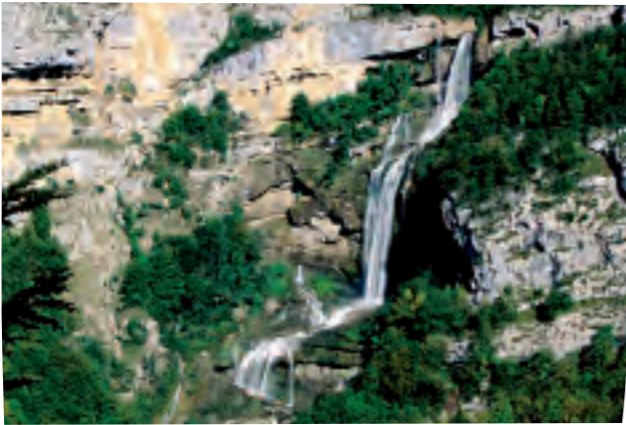
Cascade de la Charabotte : une succession de 3 sauts de 60, 40 et 15 mètres pour la rivière Albarine.