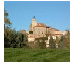
Légende : Circuit de randonnée 2

Circuit balisé en bleu, au départ de l'Espace Albert Maurice, boulevard du stade. Rejoindre le jardin public, la rue de Lyon, et monter vers l'Eglise. Continuer par le passage du Millénaire, et poursuivre le chemin de long de l'Orzon et de la Coise.