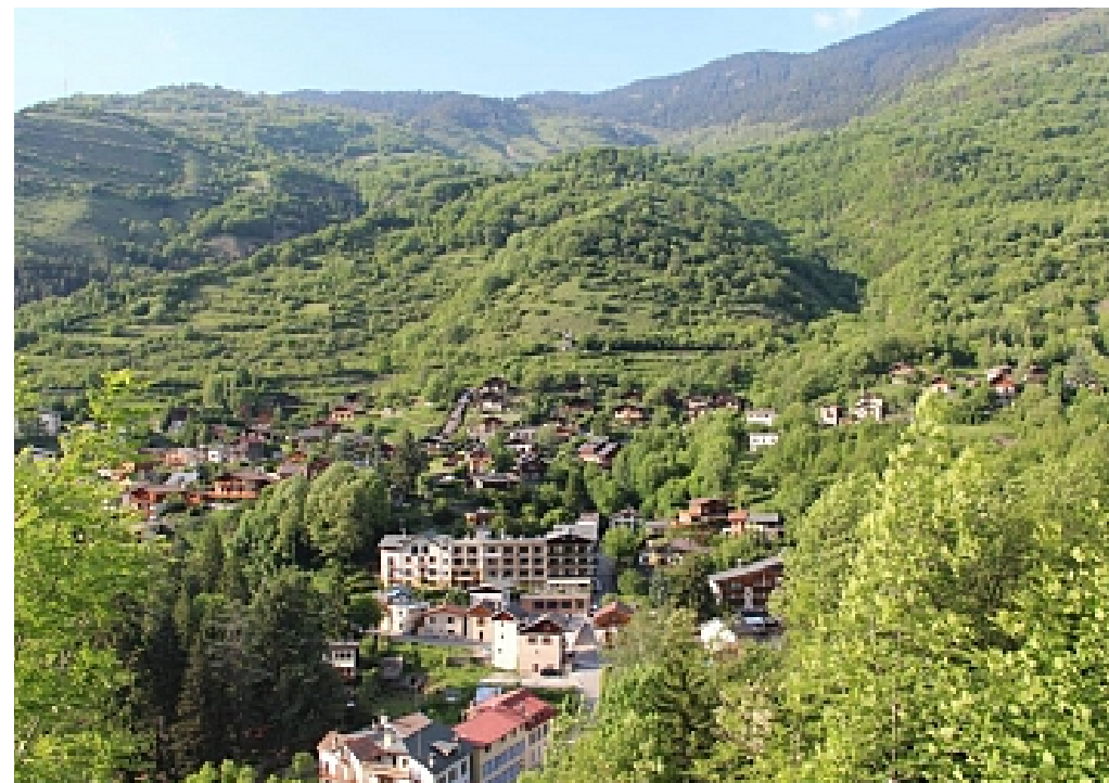
Office de Tourisme de Brides-les-Bains