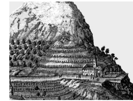
Gravure du XVIII e siècle

Le couvent* des franciscains récollets* a été fondé en 1633. Dans les années qui suivent,