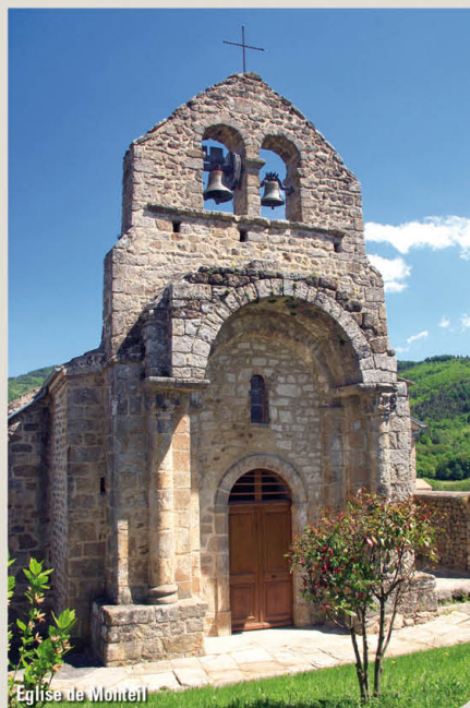
Eglise de Monteil

Vous pouvez faire seulement la boucle à partir de Monteil (1,6 km).