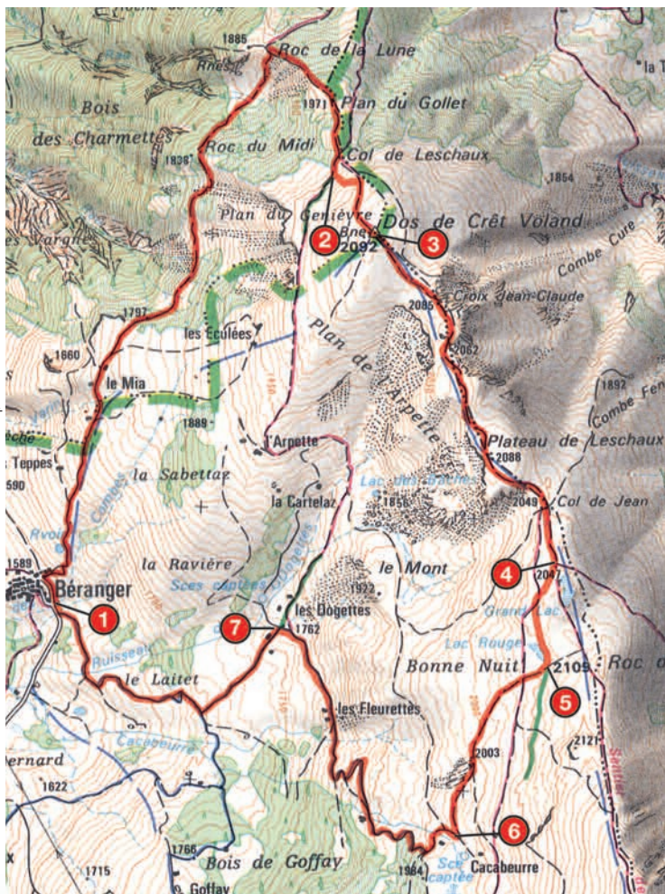
Carte IGN 1:25 000 Les Trois Vallées