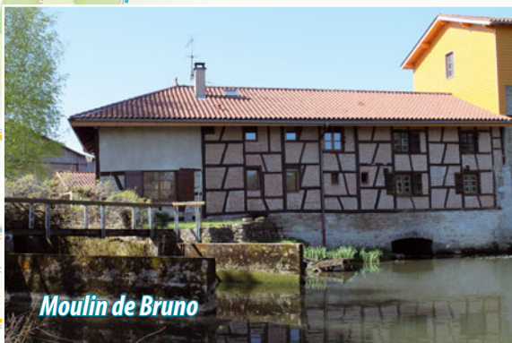
Moulin de Bruno

ATTENTION ! Traversée à deux reprises de la RD 975. Gué du Salençon (boucle sud) : le passage n'est pas possible à l'automne et en hiver.