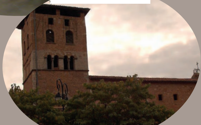
Village de Charnay et son église