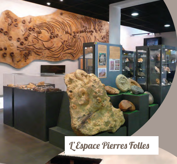
L'Espace Pierres Folles