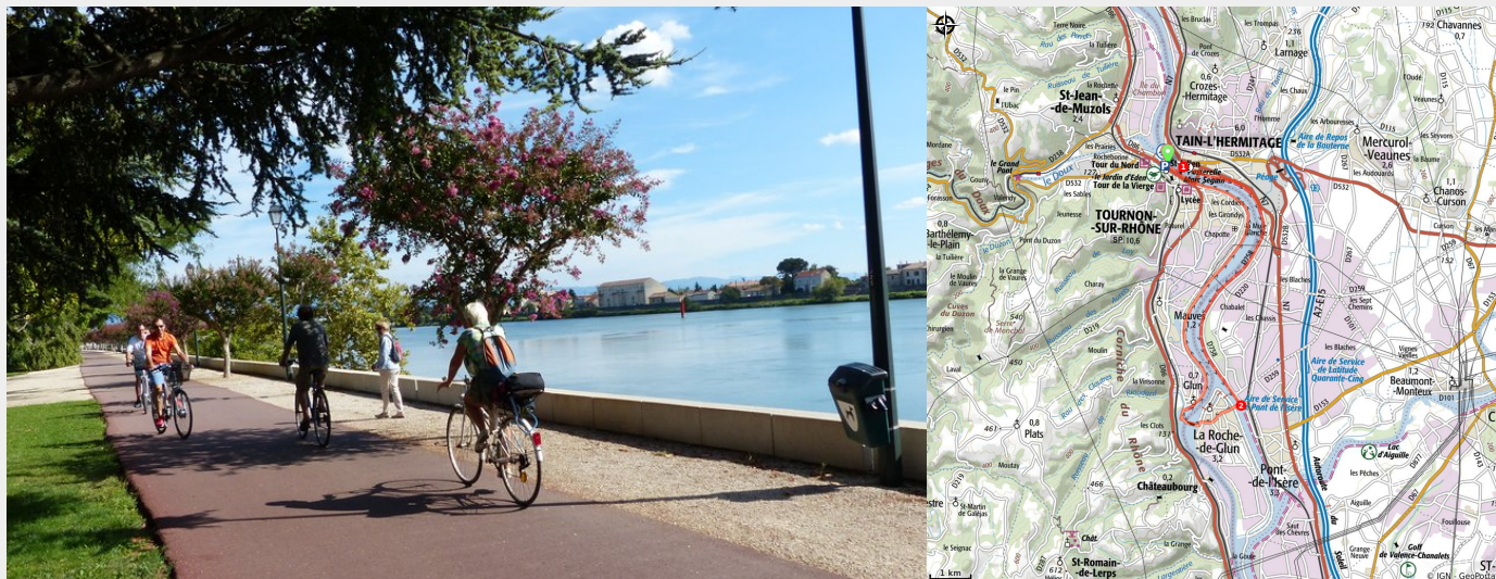
Voie de Chabalet à Tain l'Hermitage

La balade familiale pas excellence. Longez le Rhône, tantôt côté Drôme, tantôt côté Ardèche. Le tout, presque entièrement sur pistes sécurisées.