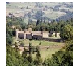
Légende : Circuit des châteaux de Larajasse

Au cours de ce circuit, vous découvrirez l'histoire de ces édifices, leurs transformations et les légendes qui les entourent. Départ conseillé : Les 3 villages. Balisage jaune accompagné d'un symbole marron représentant une croix chrétienne.