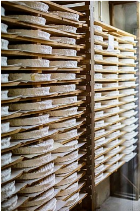
Coulommiers Pays de Brie Tourisme