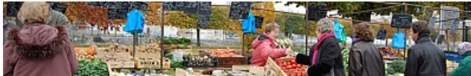
Ville de la Ferté-sous-Jouarre

Le mardi : Place de l'Hôtel-de-Ville Le vendredi : Boulevard Turenne Le dimanche : Place de l'Hôtel-de-Ville