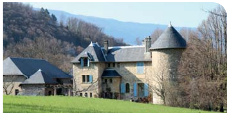
Château de Chaloz